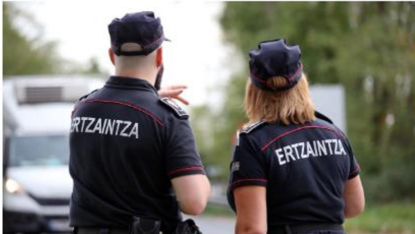
Dos agentes de la Ertzaintza

El Sindicato Profesional de la Ertzaintza (Si.P.E.) ha denunciado formalmente ante los responsables de la Consejería de Seguridad una serie de "graves episodios de acoso laboral, sexual y sexista" sufridos por dos mujeres ertzainas, una de ellas agente en prácticas y otra agente de carrera, en lo que ya consideran "un caso flagrante de violencia institucional".