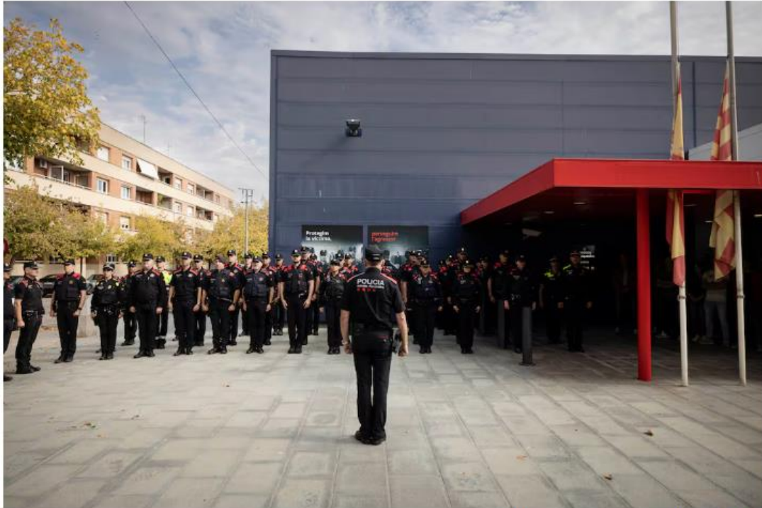
Comisaría de los Mossos d'esquadra en Mollerussa (Lleida).