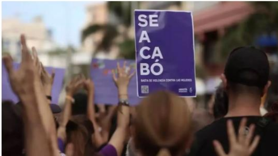
Cartel de "Se acabó" en una manifestación feminista en Las Palmas de Gran Canaria. Alejandro Ramos

La Inspección de Trabajo detectó el año pasado “92 infracciones” en materia de acoso sexual y protocolos de acoso sexual, que sancionó con multas de un total de “388.822 euros”, un 75% más que las impuestas el año anterior, según los datos solicitados al Ministerio de Trabajo por elDiario.es. Detrás de las cifras hay un contexto con plantillas más concienciadas, más denuncias y aún muchas empresas que incumplen la obligación de prevención y protección frente al acoso sexual, explican varias fuentes consultadas.