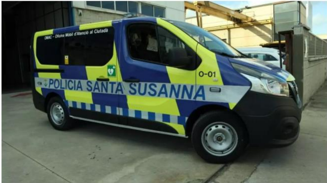
Un vehículo de la policía local de Santa Susanna