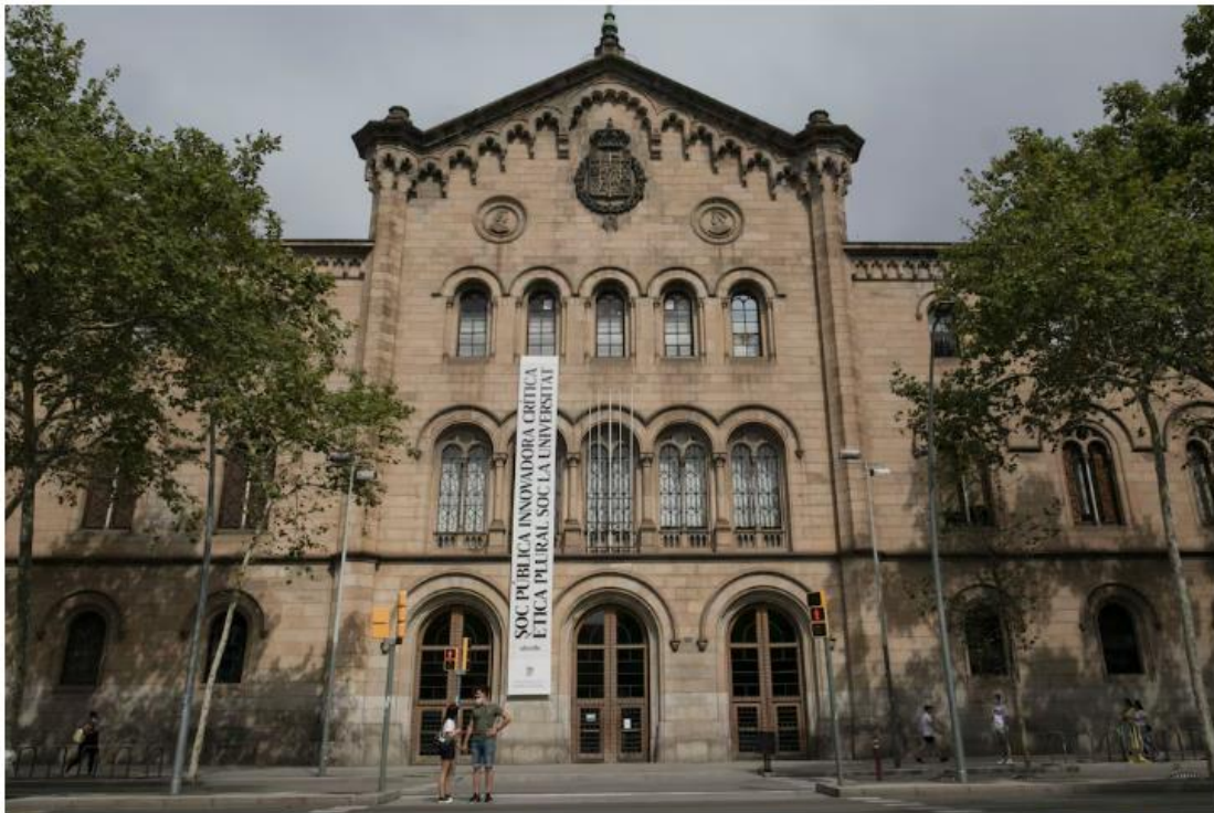
10/06/2021 - Barcelona - En la imagen la fachada del edificio histórico de la Universidad de Barcelona.

La universidad se ha comprometido “a actuar sin demora, con plenas garantías y con toda la contundencia para esclarecer esta situación”