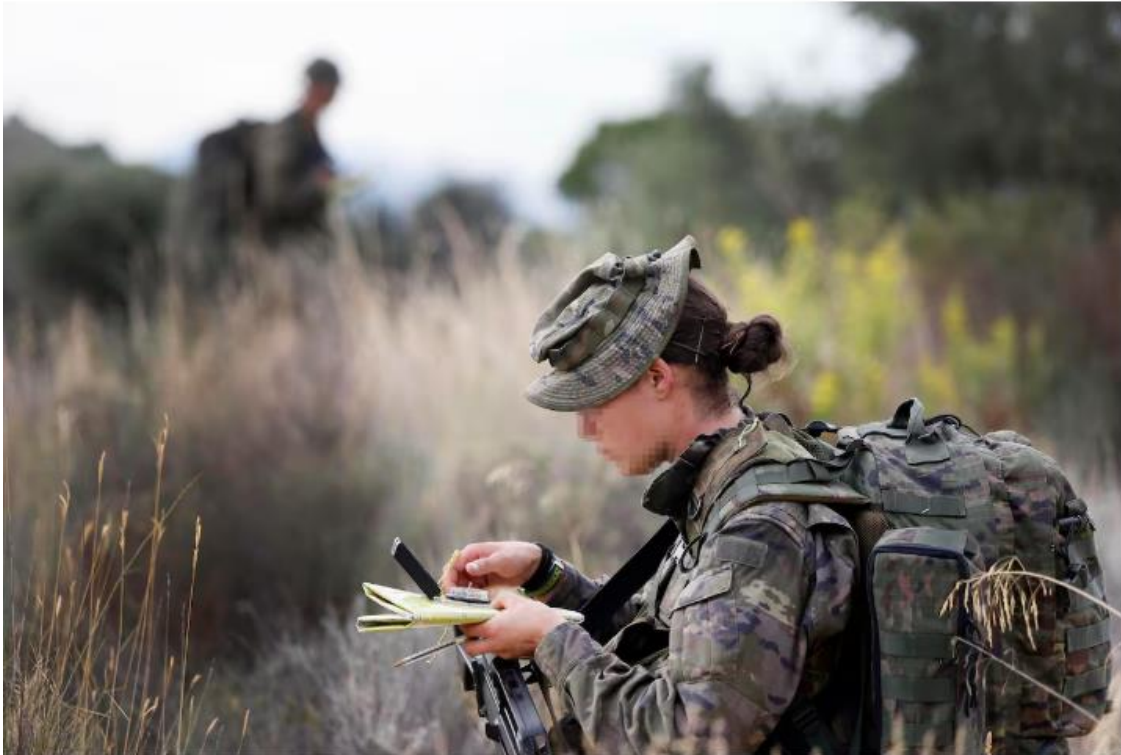
Una mujer militar durante unas maniobras del Ejército de Tierra en Alisonte.

“Las mujeres solo valen para f..... y fregar” o “no me extraña que las maten”, le espetaban a la cabo