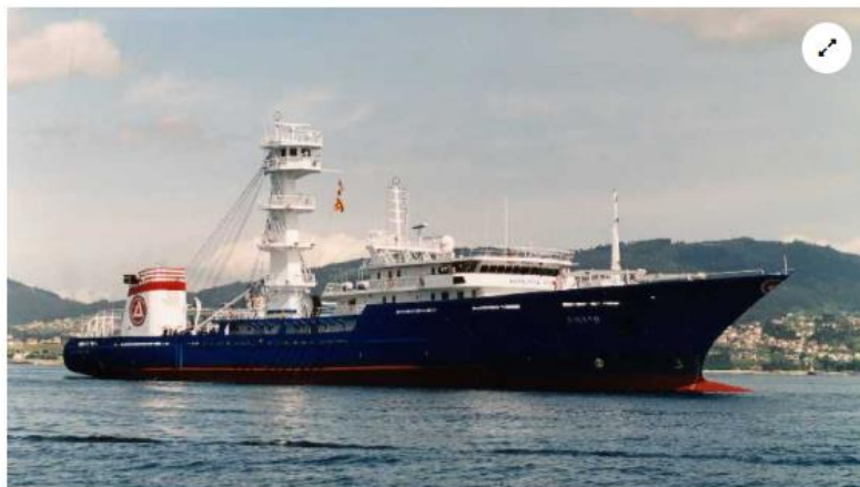
Atunero Albacora Uno Secretaría General de Pesca

Una observadora que recoge muestras para el Instituto Español de Oceanografía, subcontratada por el CSIC, fue desembarcada de un atunero para "protegerla" del acoso por razón de sexo que sufrió por parte de los oficiales a principios de enero. Desde entonces, no la han vuelto a llamar para ninguna misión científica.