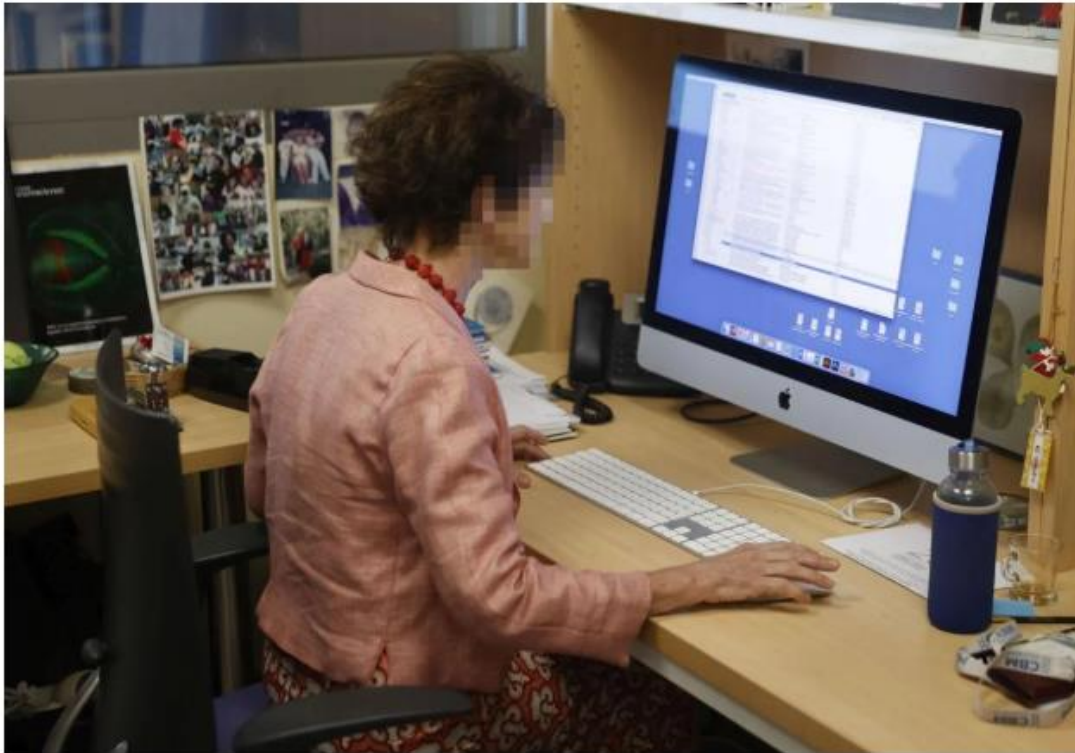
Una empleada ajena a los hechos trabaja en su puesto de trabajo en una oficina.

9- https://cadenaser.com/castillayleon/2025/06/20/he-sido-victima-de-acoso-sexual-laboralcomo-tantas-mujeres-que-habra-y-no-todas-se-atreven-a-contarlo-radio-palencia (junio 2025)