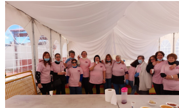
Eventos por la semana de la mujer realizados por Mujeres en Igualdad de San Martín de Valdeiglesias