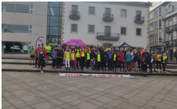
Mujeres en Igualdad de Lugo-Bumei participa en la carrera Camovil por el Día Internacional de la Mujer