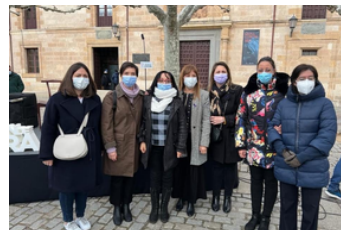
La presidenta de Mujeres en Igualdad de Zamora participa en la radio el 8M