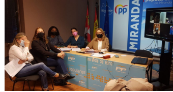
Mujeres en Igualdad de Miranda de Ebro celebra el Día de la Mujer