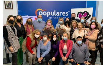
Mujeres en Igualdad del Rincón de la Victoria organizó una charla para hablar de la Mujer e Igualdad