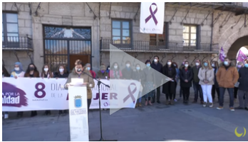
Concentración por el Día de la Mujer en Medina del Campo