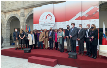
Mujeres en Igualdad de Cantabria participó el pasado #8M en el Parlamento Cántabro en un coloquio